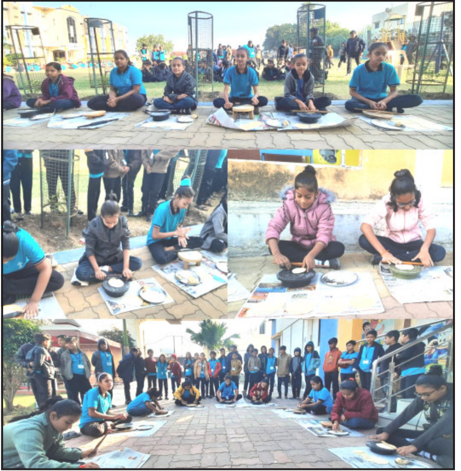
જૂનાગઢ તા. ૨ સામગ્રી પુરી પાડવામાં આવેલ શાળામાં અભ્યાસ કરતી બહેનોમાં અભ્યાસ સાથે રસોઈ બનાવવામાં કુશળતા પ્રાપ્ત થાય તેના ભાગરૂપે આઠ મિનીટમાં કેટલી રોટલી વ્યવસ્થિત અને એક સરખી સાઈઝની બનાવી શકે તેની સ્પર્ધા તા.૩૦-૧૧-૨૨ સંખ્યામાં વધારો થયો છે, જેના કારણે શહેરી માંગમાં વધારો થયો છે.

દેશ ચાવીરૂપ ઉત્પાદન માલના વેચિક વેપારમાં હિસ્સો મેળવવાનું ચાલુ રાખે છે. ભારત હાલમાં પેટ્રોલિયમ ઉત્પાદનોમાં વેચિક બજારનો ૧૩ ટકા અથવા છઠ્ઠો હિસ્સો ધરાવે છે, જે તેની વધતી જતી રિકાઈનિંગ ક્ષમતાઓ અને આંતરરાષ્ટ્રીય ધોરણોને પૂર્ણ કરવાની ક્ષમતાને પ્રમાણિત કરે છે. તે એ પણ દર્શાવે છે કે ખાનગી વપરાશ ફરીથી ઘરેલું માંગનું પ્રેરક બની ગયું છે અને તહેવારોના ખર્ચ ત્રીજા ક્વાર્ટરમાં વાસ્તવિક પ્રવૃત્તિને તેજ બનાવી છે. આવી સ્થિતિમાં, રિટેલર્સ બીજા ક્વાર્ટરની તુલનામાં ઝડપી વેચાણ વૃદ્ધિ નોંધી રહ્યા છે. આ દિવાળીમાં ઈ-ટુ-બ્લીલર્સ ધમાલ મચાવી છે, જોકે, એક અલગ પ્રીમિયમર્કેટને વધુ સ્થાન મળ્યું છે અને તે લક્ઝરી કાર સેગમેન્ટમાં છે. તે જ સમયે, દેશભરમાં નવા શહેરો વધી રહ્યા છે અને શહેરી વસ્તી ચાર ગણી વધી રહી છે. ૨૦૨૫ સુધીમાં, ભારતની અડધી આબાદીના ૧૦૦,૦૦૦ થી વધુ થવાની ધારણા છે. HSBC સર્વે મુજબ, શહેરોમાં રહેતા લોકોની સંખ્યામાં વધારો થયો છે, જેના કારણે શહેરી માંગમાં વધારો થયો છે.