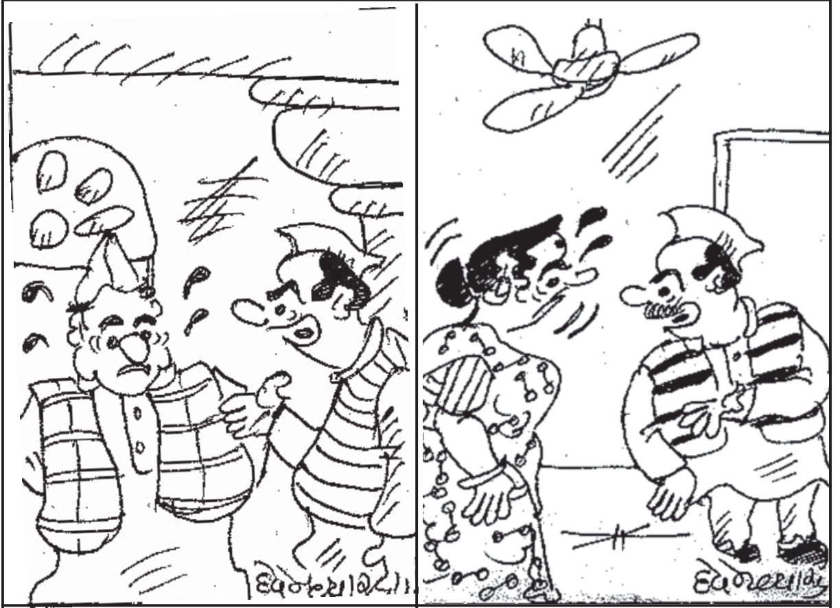
પ્રજાનું લોહી પીસે છે તો તને બ્લડપ્રેસર તો રહેશે જ ને?

નેતાઓનું પ્રતિનિધિમંડળ જે સંભલ જવાનું હતું તેમાં યુપી વિધાનસભામાં વિરોધ પક્ષના નેતા માતા પ્રસાદ પાંડે પણ સામેલ હતા, જેમણે પૂછ્યું હતું કે ‘સરકાર સંભલમાં શું છુપાવવા માંગે છે?’ તેણે કહ્યું કે પહેલા તેણે શુક્રવારે જવાની યોજના બનાવી હતી, પરંતુ પ્રશાસને તેને ત્રણ દિવસ રોકાવાનું કહ્યું હતું, અને કહ્યું હતું કે શુક્રવારે શાંતિ ભંગ થવાનો ભય હતો, પરંતુ હવે પણ તેને જવા દેવામાં આવી નથી. માતા પ્રસાદ પાંડેએ કહ્યું કે સંભલની દરેક ગલીમાં પ્રેસના લોકો ફરે છે, એકલા સપાના પ્રતિનિધિમંડળથી શું ખતરો છે? તેમણે કહ્યું કે, હું વિપક્ષનો નેતા છું. હજુ સુધી કોઈ પ્રશાસનિક અધિકારી દ્વારા મને કોઈ નોટિસ આપવામાં આવી નથી.