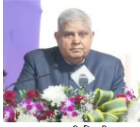
નવી દિલ્હી, તા.૪:

ઉપરાષ્ટ્રપતિ જગદીપ ધનખડે ખેડૂતોના આંદોલનને લઈને કેન્દ્ર સરકારને સીધા સવાલો પૂછ્યા છે. ધનખડે કૃષિ મંત્રી શિવરાજ સિંહ ચૌહાણને પૂછ્યું કે ખેડૂતોને આપેલા વાયદાઓનું શું થયું અને તે કેમ પૂરું ન થયું ? આ સાથે ઉપરાષ્ટ્રપતિએ એવો પણ સવાલ ઉઠાવ્યો હતો કે ખેડૂતો સાથે કેમ વાત કરવામાં આવતી નથી અને તેમના હક કેમ આપવામાં આવતા નથી. ધનખડે ખેડૂતોની સમસ્યાઓ અંગે સરકારની નીતિઓ પર ગંભીર ચિંતા વ્યક્ત કરી અને તાત્કાલિક ઉકેલની જરૂરિયાત પર ભાર મૂક્યો.