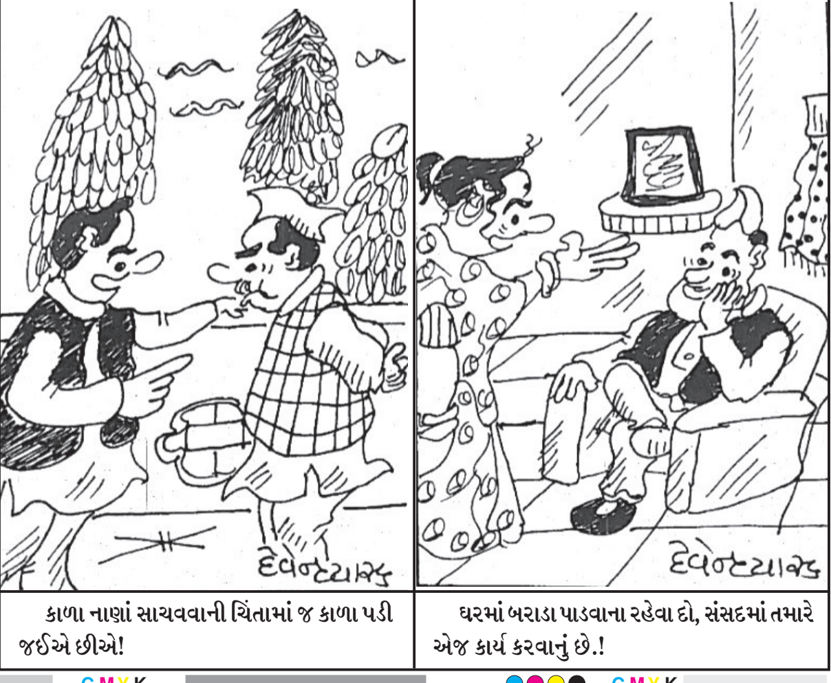
કાળા નાણાં સાચવવાની ચિંતામાં જ કાળા પડી જઈએ છીએ! ઘરમાં બરાડા પાડવાના રહેવા દો, સંસદમાં તમારે એજ કાર્ય કરવાનું છે.!

જૂનાગઢ, તા.૪ કૃષિ ઉત્પાદનના પરિવહન માટે રાજ્યના ખેડૂતો માટે કૃષિ ઉત્પાદન પરિવહન સરળ બનાવવાના હેતુસર માલ વાહક વાહન અને ટ્રેક્ટર ટ્રેલરની ખરીદી ઉપર નાણાકીય સહાય આપવાની કિસાન પરિવહન યોજના કૃષિ વિભાગ દ્વારા ચલાવવામાં આવી રહી છે. વર્ષ ૨૦૨૪-૨૫ માટે ખેતીવાડી ખાતાની કિસાન પરિવહન યોજનામાં માલ વાહક વાહન અને ટ્રેક્ટર ટ્રેલર ઘટકમાં તા.૫/૧૨/૨૦૨૪થી ઓનલાઈન અરજીઓ મેળવવા માટે આઈ-ખેડૂત પોર્ટલ ખુલ્લું મુકવામાં આવનાર છે. જેની સહુ ખેડૂતમિત્રોએ નોંધ લેવા જણાવવામાં આવે છે. વધુ જાણકારી માટે આપના વિસ્તારના ગ્રામસેવક અથવા તાલુકા પંચાયત કચેરીએ ખેતીવાડી શાખાનો સંપર્ક કરવા જિલ્લા ખેતીવાડી અધિકારીશ્રી, જૂનાગઢ દ્વારા અનુરોધ કરવામાં આવે છે.