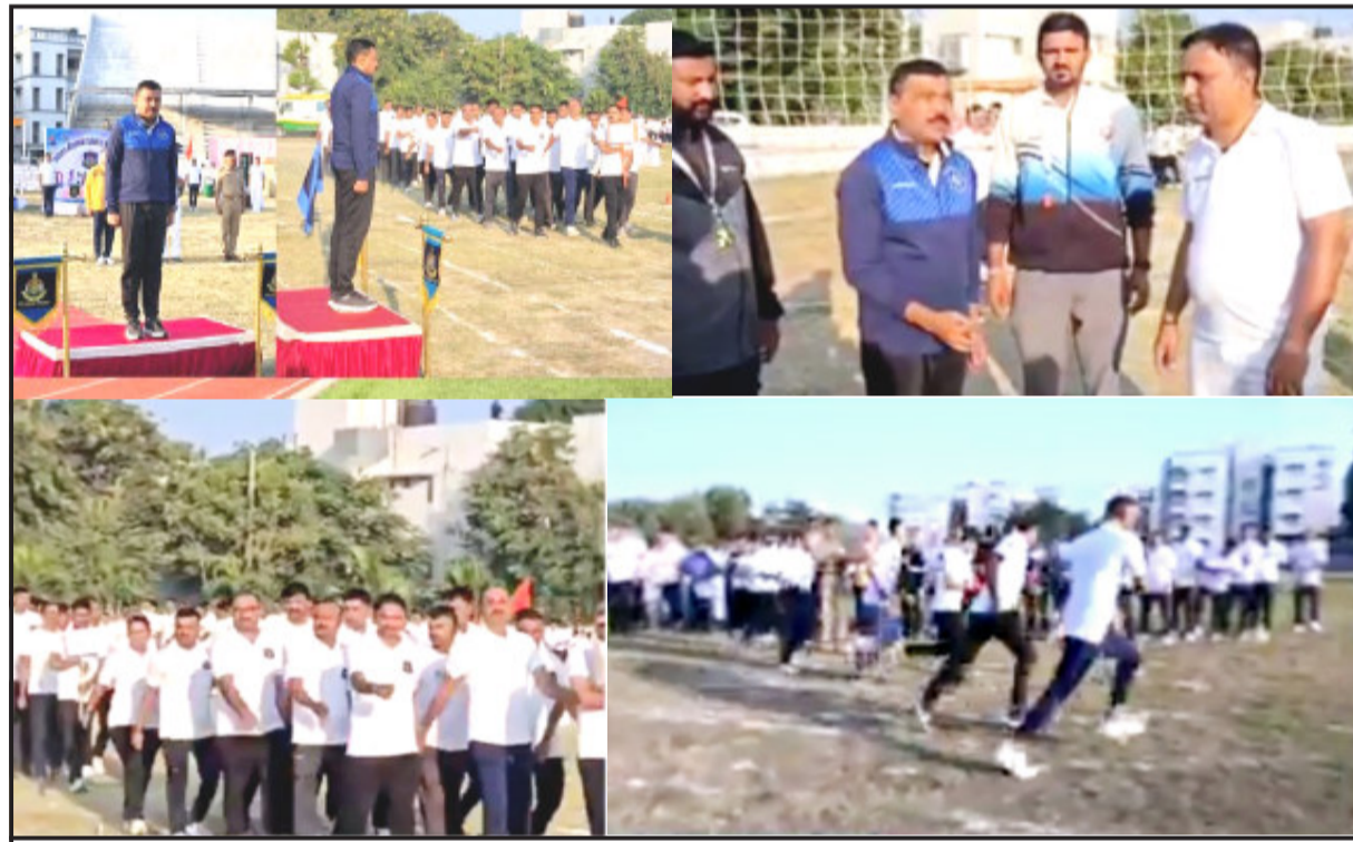
(પ્રતિનિધિ દ્વારા) પ્રભાસ પાટણ તા.