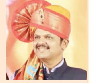
ભાજપના કેન્દ્રીય નિરીક્ષકો વિજય રૂપાણી અને નિર્મલા સીતારમણ કાર્યકારી સીએમ એકનાથ શિંદેને મળશે. આ પછી, મુખ્યમંત્રી ફડણવીસ અને બંને નાયબ મુખ્યમંત્રી રાજ્યપાલને મળશે અને સરકાર બનાવવાનો દાવો રજૂ કરશે. શપથ ગ્રહણ આવતીકાલે એટલે કે પીસેમ્બરે મુંબઈના આઝાદ મેદાનમાં યોજાશે. જેમાં મુખ્યમંત્રી અને બંને ડેપ્યુટી સીએમ શપથ લેશે. તેમની સાથે કેટલા મંત્રીઓ શપથ લેશે કે નહીં તે હજુ સ્પષ્ટ નથી. નિર્મલા સીતારમણ અને વિજય રૂપાણીએ મુખ્યમંત્રી પદે દેવેન્દ્ર ફડણવીશના નામ અંગે સર્વસંમતિથી વરણી કરવામાં આવી હોવાનું જાહેર કર્યું હતું. ત્યારબાદ દેવેન્દ્ર ફડણવીશ જાહેર જનતાનો તેમજ તમામ ધારાસભ્યોનો આભાર માન્યો હતો.

મુંબઈ તા.૦૪ મહારાષ્ટ્ર ભાજપ વિધાનસભા પક્ષની બેઠકમાં દેવેન્દ્ર ફડણવીસને મુખ્યમંત્રી તરીકે પસંદ કરવામાં આવ્યા છે. અગાઉ કોર કમિટીની બેઠકમાં પણ તેમના નામ પર સહમતિ સધાઈ હતી. મહાયુતિની બેઠકમાં આ નિર્ણય લેવામાં આવ્યો હતો.