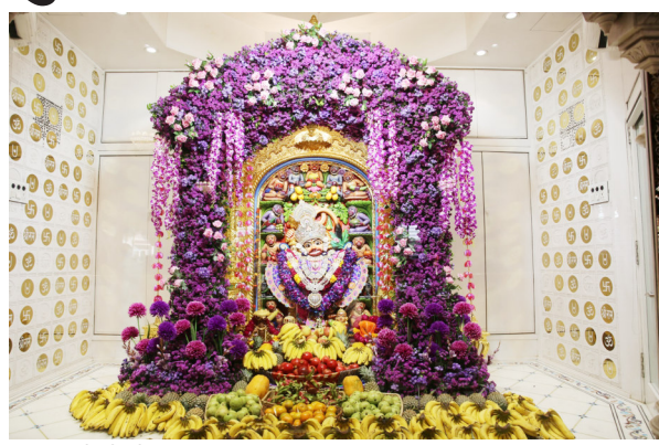
(પ્રતિનિધિ દ્વારા) યાત્રાધામ સાળંગપુરમાં શ્રી સાળંગપુર તા.૭ શ્રી સ્વામિનારાયણ મંદિર વડતાલધામ સંચાલિત સુપ્રસિદ્ધ