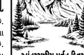
આંતરરાષ્ટ્રીય પર્વત દિવસ

વર્ષ ૨૦૦૩થી સંયુક્ત રાષ્ટ્ર દ્વારા દર વર્ષે ૧૧ ડીસેમ્બરના દિવસને “આંતરરાષ્ટ્રીય પર્વત દિવસ” તરીકે ઉજવવામાં આવે છે. પર્યાવરણની દ્રષ્ટીએ જોઈએ તો તમામ પ્રકારનાં પર્વતો મહત્ત્વનાં છે પછી ભલે તે બરફ આરંધિત હોય કે સંપૂર્ણ લીલોતરીથી મહકતા હોય. દરેકે દરેક પ્રકારનાં પર્વતોમાં વિવિધ પ્રકારની જીવસૃષ્ટિ વસે છે. પશુ, પક્ષી, પ્રાણીઓથી