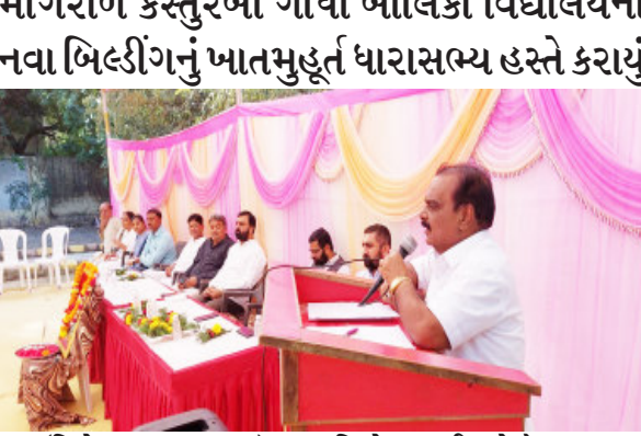
(નિલેશ રાજપરા દ્વારા)

સરખામણીમાં ચાલુ વર્ષે મિલકત વિરૂધ્ધના ગુનાઓમાં રાજ્યમાં અસંખ્ય રાજ્યમાં આ પ્રોજેક્ટનો વ્યાપ વધારીને હવે 'એક આરોપી સામે એક પોલીસ મેન્ટર' એમ ૬૫૦૦ રીઠા આરોપીઓનું ડેઈલી સર્વેલન્સ કરવામાં આવશે : રાજ્યના પોલીસ વડા વિકાસ સહાય