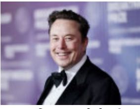
પ્રથમ વ્યક્તિ બન્યા છે જેમની કુલ નેટવર્થ ૪૦૦ બિલિયન છે. આજ સુધી આવી ઈતિહાસ કોઈએ રચ્યો નથી. બ્લૂમબર્ગના રિપોર્ટ અનુસાર,

નવી દિલ્હી, તા. ૧૨ : બ્લૂમબર્ગના રિપોર્ટ અનુસાર, સ્પેસએક્સના ઈનસાઈડર ટ્રેડિંગ વેચાણને કારણે એલોન મસ્કની નેટવર્થમાં અચાનક ૫૦ અબજ ડોલરનો વધારો થયો છે. જેના કારણે તેમની કુલ નેટવર્થ વધીને ૪૦૦ બિલિયન ડોલરથી વધુ થઈ ગઈ છે. એલોન મસ્ક વિશ્વના