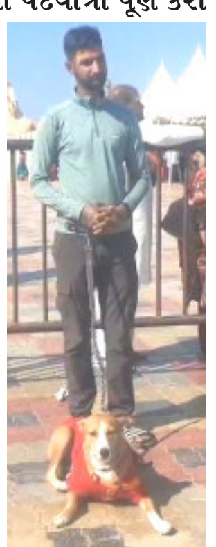
પદયાત્રા કરી ઉત્તરાખંડમાં બદ્રીનાથ પહોંચી પૂર્ણ કરશે.

૧૧,૫૦૦ કી.મી.ની પદયાત્રા પૂર્ણ કરી ક્યારેય કોઈના દુર્વ્યવહારનો ભોગ નથી બનવું પડ્યું એ આપણા ભારત વર્ષની સંસ્કૃતિને ઉજાગર કરે છે. ઉત્તરાખંડના બદ્રીનાથથી શરૂ કરેક પરિક્રમા કરી બદ્રીનાથ ખાતે જ પૂર્ણ કરશે. અંદાજે ૧૫ હજાર કી. મી. ની પદયાત્રામાં યુવકે ૧૧,૫૦૦ કી. મી.ની યાત્રા સફળતા પૂર્વક પૂર્ણ કરી છે. સોમનાથ જ્યોતિર્લિંગના દર્શન સાથે ૧૧ જ્યોતિર્લિંગ અને ત્રણ ધામના દર્શન પરિપૂર્ણ કર્યા છે. આગામી દિવસોમાં સોમનાથથી અંતિમ ચરણમાં દ્વારકાથી મંદિર અને નાગેશ્વર જ્યોતિર્લિંગના દર્શન કરી ચાર ધામ અને ૧૨ જ્યોતિર્લિંગના દર્શનની કામના પૂર્ણ કરશે અને ફરી ઉત્તરાખંડ બદ્રીનાથ પહોંચ્યા બાદ પદયાત્રાની પરિક્રમા પૂર્ણ કરશે. બદ્રીનાથથી પદયાત્રાનો પ્રારંભ કરી ઉત્તર પ્રદેશમાં કાશી