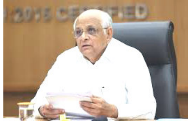
મુખ્યમંત્રીના હસ્તે સંપત્ર થશે ● અમદાવાદમાં શ્રમિક સુવિધા કેન્દ્ર લોકાર્પણ થકી - ગરીબ ઉત્કર્ષ ● રાજ્ય સરકારના વિભાગોમાં ૬૦૦ યુવાઓને નિમણૂક પત્રો એનાયતથી - યુવા વિકાસ ● ખેડૂતો-અગ્રદાતાઓના FPO સાથે સંવાદથી - અગ્રદાતા વિકાસ ● મહિલા સ્ટાર્ટઅપ - ઈનોવેટર્સ સાથે સંવાદથી - નારીશક્તિ વિકાસ સંવાદ કાર્યક્રમથી નવી દિશા પદાર્પણનો પ્રથમ દિવસ એટલે કે આપશે. મુખ્યમંત્રી ભૂપેન્દ્ર આજ તા. ૧૨મી ડિસેમ્બર પટેલના વડપણની વર્તમાન ૨૦૨૪ સમગ્રતયા 'ગ્યાન' સરકારના ત્રીજા વર્ષમાં સમર્પિત વિકાસ દિવસ બનશે.

આયામી આયોજન કરવામાં આવ્યું છે. મુખ્યમંત્રી ભૂપેન્દ્ર પટેલ અને રાજ્ય મંત્રી મંડળના મંત્રીઓ વર્તમાન રાજ્ય સરકારના ત્રીજા વર્ષમાં મંગળ પ્રવેશ અવસરે આ 'ગ્યાન' આધારિત વિવિધ કાર્યક્રમોમાં સહભાગી થવાના છે. મુખ્યમંત્રી શ્રી ભૂપેન્દ્ર પટેલ સેવા, સંકલ્પ અને સમર્પણના બે વર્ષ પૂર્ણ કરીને તૃતીય વર્ષમાં પદાર્પણ અવસરે આજ તા. ૧૨મી ડિસેમ્બર, ગુરુવારના દિવસનો પ્રારંભ અમદાવાદ મહાનગર પાલિકા દ્વારા નરોડામાં ૩૦૦ ચોરસ મીટરમાં નિર્માણ પામેલા શ્રમિક સુવિધા કેન્દ્રના લોકાર્પણ દ્વારા ગરીબ ઉત્થાન કાર્યક્રમથી કરશે. મુખ્યમંત્રીશ્રી 'ગ્યાન'ના બીજા મહત્વપૂર્ણ પિલ્લર એવા યુવાઓના ઉજ્જવળ ભવિષ્યની નેમ સાથે સવારે ૧૧ કલાકે ગાંધીનગરના મહાત્મા મંદિરમાં યોજનાના કાર્યક્રમમાં રાજ્ય સરકારના વિવિધ વિભાગોમાં પસંદગી પામેલા ૫૮૦ યુવાનોને નિમણૂક પત્રો એનાયત કરવાના છે. મુખ્યમંત્રી ભૂપેન્દ્ર પટેલે 'અગ્રદાતા'ને પ્રોત્સાહન અને પ્રેરણા આપવા ખેડૂત ઉત્પાદક સંગઠનો FPOના સદસ્યો સાથે મુખ્યમંત્રી નિવાસસ્થાને સંવાદ કાર્યક્રમનું પણ આયોજન કર્યું છે. ખેત પેદાશોના મહત્તમ ઉત્પાદન, વેલ્યુએડિશન, બ્રાન્ડિંગ અને