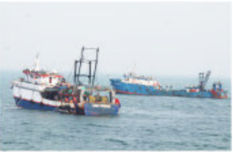
ઉદ્દેશ્યથી લેવામાં આવ્યું છે. ગેરકાયદેસર પ્રવૃત્તિઓને રોકવા પછા આવી કાર્યવાહી ચાલુ વધુમાં અધિકારીએ સ્પષ્ટ કહ્યું કે અને કાબજીમાં લેવા ભવિષ્યમાં રહેશે.