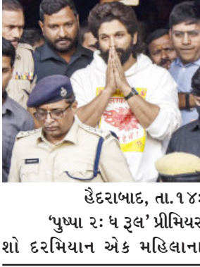
હેદરાબાદ, તા. ૧૪ : 'પુષ્પા ૨: ધ રૂલ' પ્રીમિયર શો દરમિયાન એક મહિલાના

મુત્યુના સંબંધમાં દક્ષીણના લોકપ્રિય અભિનેતા અલ્લુ અર્જુનને આજે સવારે ચંચલગુડા સેન્ટ્રલ જેલમાંથી મુક્ત કરવામાં આવ્યો હતો. અભિનેતાને શુક્રવારે સાંજે તેલંગાણા હાઈકોર્ટ દ્વારા વચગાળાના જામીન આપવામાં આવ્યા હતા, જ્યારે નીચલી અદાલતે તેને ૧૪ દિવસની ન્યાયિક કસ્ટડીમાં મોકલી દીધો હતો. જેલ સત્તાવાળાઓ દ્વારા જામીન મેળવવામાં વિલંબને કારણે તેને