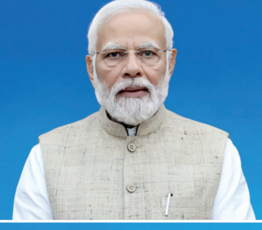
શ્રી નરેન્દ્ર મોદી માનનીય વડાપ્રધાન, ભારત

“ હું ખરેખર રોમાંચિત છું કે કચ્છનું ધોરડો ગામ, તેના સમૃદ્ધ સાંસ્કૃતિક વારસા અને પ્રાકૃતિક સૌંદર્ય માટે પ્રસિદ્ધ થઈ રહ્યું છે. આ સન્માન ભારતીય પ્રવાસનની ક્ષમતાનું જ નહીં, પરંતુ કચ્છના લોકોના સમર્પણને પણ પ્રદર્શિત કરે છે.