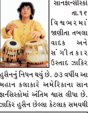
હુસૈનનું નિધન થયું છે. ૭૩ વર્ષીય આ મહાન કલાકારે અમેરિકાના સાન ફ્રાન્સિસ્કોમાં અંતિમ શ્વાસ લીધા છે. ઝાકિર હુસૈન છેલ્લા કેટલાક સમયથી

સાનફ્રાન્સિસ્કો તા. ૧૬ વિશ્વ ભરમાં જાણીતા તબલા વાદક અને સંગીતકાર ઝાકિર હુસૈનનું નિધન થયું છે. ૭૩ વર્ષીય આ મહાન કલાકારે અમેરિકાના સાન ફ્રાન્સિસ્કોમાં અંતિમ શ્વાસ લીધા છે. ઝાકિર હુસૈન છેલ્લા કેટલાક સમયથી ગંભીર સ્વાસ્થ્ય સમસ્યાનો સામનો કરી રહ્યાં હતા અને તેમને હોસ્પિટલમાં દાખલ કરવામાં આવ્યા હતા. તેમના પરિવારે તેમના નિધનની પુષ્ટિ કરી છે. વિશ્વપ્રસિદ્ધ તબલાવાદક અને પદ્મ વિભૂષણ ઉસ્માદ ઝાકિર હુસૈનનું નિધન થયું. આજે સવારે તેમના પરિવારે આ વાતની પુષ્ટિ કરી હતી. ઝાકિર હુસૈન, જેમણે સંગીતનો વારસો પોતાની નસોમાં જાળવી રાખ્યો હતો, તે દેશના એવા કલાકારોમાંના એક હતા જેમણે ભારતીય શાસ્ત્રીય સંગીતને વૈશ્વિક સ્તરે ગૌરવ અપાવ્યું હતું.