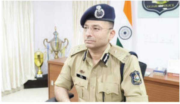
જૂનાગઢ તા. ૧૭

બેંક એકાઉન્ટમાં ફોડનાં નાણાં જમા કરાવી ક્રોમાંદ આચરવામાં આવતું હોવાની સનસનાટી ભરી વિગતો બહાર આવી