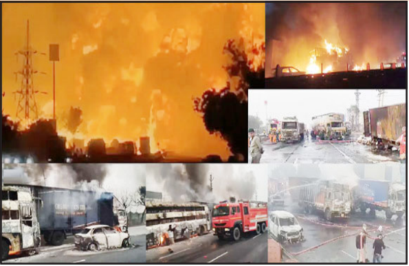
જયપુર, તા. ૨૦ ગંભીર દુર્ઘટનામાં જયપુર-અજમેર આજે સવારે બનેલી એક ઘાંટે પર દિલ્હી પબ્લીક સ્કૂલની