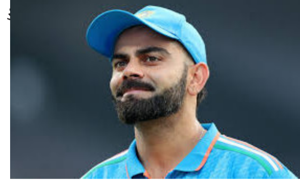
નવી દિલ્હી, તા.૨૩ ટીમ ઈન્ડિયા શ્રિરંભેનથી મેલબોર્ન જવા માટે નીકળી હતી. જોકે આ દરમિયાન ટીમનો સ્ટાર બેટર વિરાટ કોહલી મેલબોર્ન પહોંચતા જ ઓસ્ટ્રેલિયાની એક મહિલા ટીવી પત્રકાર પર ભડક્યો હતો. રિપોર્ટમાં દાવો કર્યો છે કે ૨૬ ડિસેમ્બરથી શરૂ થઈ રહેલી બોર્કિસગ ૩ ટેસ્ટ પહેલાં વિરાટ કોહલી મેલબોર્નમાં એક ઓસ્ટ્રેલિયન ટીવી પત્રકાર પર કથિત રીતે ગુસ્સે થયો હતો. વિરાટને કેમ અચાનક ગુસ્સો આવ્યો? આનું કારણ બહારે આવ્યું નથી, પરંતુ તે કથિત રીતે તેના પરિવાર તરફ કેમેરા ફેરવવાથી ગુસ્સે હતો. મહિલા પત્રકારે કહ્યું કે, કેમેરા જોઈને કોહલી ગુસ્સે થઈ ગયો. તેને

વિરાટે મહિલા પત્રકારને વિનંતી કરી કે તે તેની તસ્વીરો ચલાવે પરંતુ તેના પરિવારની તસ્વીરો ડિલીટ થઈ ગયો. વિરાટે મહિલા પત્રકારને વિનંતી કરી કે તે તેની તસ્વીરો ચલાવે પરંતુ તેના પરિવારની તસ્વીરો ડિલીટ કરે. પરંતુ પત્રકારે કોહલીની વાત ન સાંભળી. આ બાબતે કોહલીએ આ મહિલા પત્રકાર સાથે દલીલ કરી હતી. ઓસ્ટ્રેલિયન કાયદા અનુસાર, કોઈ પણ સાર્વજનિક સ્થળે કોઈ પણ સેલિબ્રિટીના વીડિયો કે ફોટોગ્રાફ લેવા પર કોઈ પ્રતિબંધ નથી. ભારત અને ઓસ્ટ્રેલિયા વચ્ચે બોર્ડર ગાવસ્કર ટ્રોફીની આગામી ટેસ્ટ ૨૬મી ડિસેમ્બર (બોર્કિસગ ૩) થી યોજાશે. અગાઉ, ૧૮ ડિસેમ્બરે રમાયેલી ગાબા ટેસ્ટ ડ્રોમાં સમાપ્ત થઈ હતી. આ મેચમાં ઓસ્ટ્રેલિયાએ તેની પ્રથમ ઈનિંગમાં ૪૪૫ રન બનાવ્યા હતા. ત્યારબાદ ભારતીય ટીમ પ્રથમ દાવમાં ૨૬૦ રનમાં ઓલઆઉટ થઈ ગઈ હતી. આ પછી ઓસ્ટ્રેલિયાએ તેનો બીજો દાવ ૮૯ રન પર ડિકલેર કર્યો હતો. આ રીતે ભારતીય ટીમને જીતવા માટે ૨૭૫ રનનો સ્કોર મળ્યો હતો. પરંતુ જ્યારે ભારતનો સ્કોર ૮/૦ હતો ત્યારે વરસાદને કારણે મેચ પાંચમા દિવસે રમાઈ શકી ન હતી.