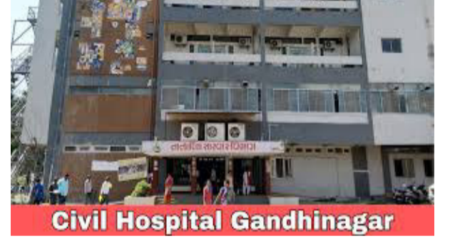
હવે ચાલુ થશે ત્યારે વધુ લાંબી લાઈનો જોવા મળશે. જો કે આ ઈકોનું મશીન બગાડતા દર્દીઓને ધકકા ખાવાનો વારો આવ્યો છે. 2D ઈકો નવું મશીન વસાવવા માટે સરકાર સમક્ષ સિવિલ તંત્ર દ્વારા માંગણી કરવામાં આવી છે. હાલ એમઆરઆઈ, સીટી સ્કેન, સોનોગ્રાફી, એક્સ-રે સહિતની સુવિધા કાર્યરત છે.

ગાંધીનગર, તા.૨૩ ગાંધીનગર શહેરમાં અદ્યતન સાધનો સાથેની ૬૦૦ બેડની સિવિલ હોસ્પિટલ બનાવવામાં આવી છે, પરંતુ ખાટલે મોટી ખોડ એવી છે કે છેલ્લા કેટલાક સમયથી 2D ઈકો મશીન બંધ હાલતમાં પડ્યું છે. અઠવાડિયામાં માત્ર બે દિવસ બે કલાક માટે ઈકો કરવામાં આવતું હોવાથી દર્દીઓ પરેશાન થઈ રહ્યાં છે. ઈમર્જન્સી દર્દીઓને ખાનગી હોસ્પિટલમાં વધુ પૈસા ખર્ચીને ઈકો કરાવવાની ફરજ પડે છે. ગાંધીનગર સિવિલમાં હાલકાર્યાલય સેન્ટર ઉભુ કરવામાટે તડામાર તેયારીઓ ચાલી રહી છે. ૬૦૦ બેડની હોસ્પિટલમાં ત્રણ માળ સુધીના તમામ વોર્ડ, ઓટી સહિત સ્પેશ્યલ વોર્ડ અને મેડીકલ સ્ટોર પણ ખસેડી દેવાયો છે. ગાંધીનગર સિવિલમાં આરોગ્ય લક્ષી સુવિધા વધતા દર્દીઓનો ધસારો પણ મોટી સંખ્યામાં થઈ રહ્યો છે. ત્યારે શિયાળાની ભારે ઠંડીમાં હૃદય સંબંધી દર્દીઓની સંખ્યા વધુ જોવા મળે છે. ડોક્ટરની તપાસ બાદ દર્દીને 2D ઈકો કરવા માટે કહેવામાં આવે છે. 2D ઈકો મશીનમાં યાંત્રિક ખામી સર્જવાના કારણે દર્દીઓ વારંવાર ધકકા ખાઈ રહ્યાં છે. સિવિલમાં માત્ર બુધવાર અને શુક્રવારના રોજ બપોરે બે કલાક માટે ઈકો કરવામાં આવે છે. તેના કારણે ઈકો માટે દર્દીઓની લાંબી લાઈનો લાગે છે. ત્યારે હાલના તબક્કે ઈકોનું મશીન ખોટકાયુ છે