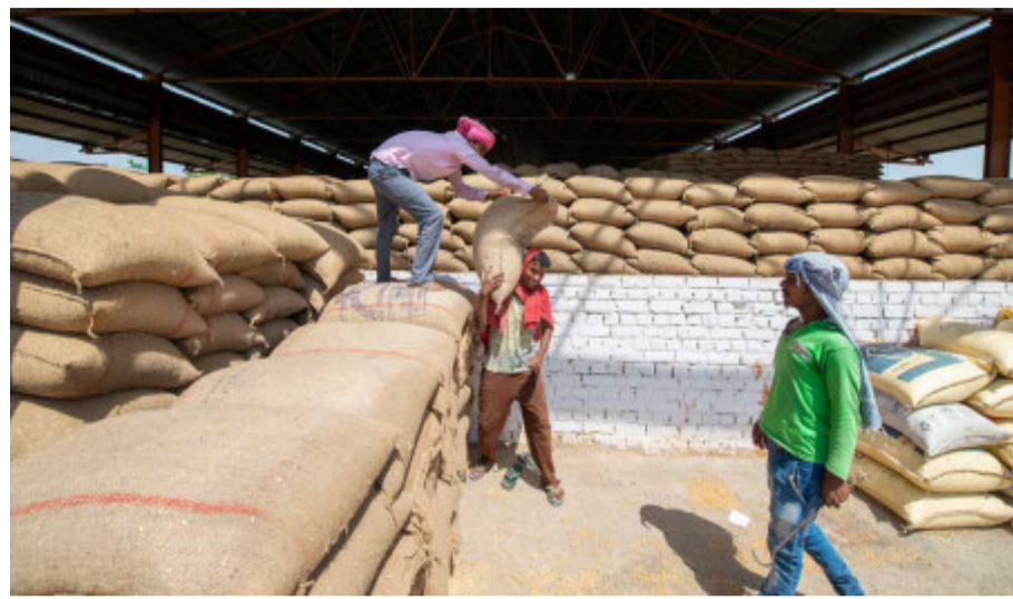
ગરીબો સુધી પહોંચતું નથી. જાહેર વિતરણ વ્યવસ્થા હેઠળ સમગ્ર દેશમાં ૨૮ ટકા લીકેજ, જાહેર વિતરણ વ્યવસ્થાના અનાજનો બગાડ અટકાવવા જરૂરી છે. હોવાનું

દેશમાં લક્ષિત વિતરણ વ્યવસ્થા હેઠળ નિયમીત રીતે વિવિધ અનાજ આપવામાં આવે છે જેમાં લીકેજ એટલે કે કાળાબજારમાં ધકેલાઈ જતા અનાજ અને કુડ કોર્પોરેશન ઓફ ઈન્ડિયાના ગોડાઉનમાં પણ હજારો ટન અનાજ સડી જાય છે. હાલમાં જ એક ઈકોનોમીક થીંક ટેન્ક દ્વારા આપવામાં આવેલા તારણ મુજબ સરકારી વિતરણનું ૨૮% અનાજ એટલે કે, ૨ કરોડ ટન ચોખા-ઘઉં આશરે કિંમત રૂ.૬૯,૦૦૦ કરોડનું અનાજ ગરીબો સુધી પહોંચતું જ નથી. આ વાર્ષિક નુકસાન છે. આ