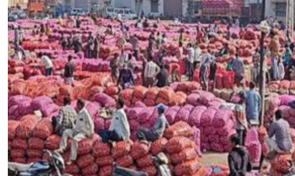
રાજકોટ, તા.૨૩ ડુંગળી ભરેલા વાહનોની ગોંડલ યાર્ડમાં લાંબી લાઈનો

જોવા મળી. ખેડૂતોને હરાજ પ્રક્રિયા દરમિયાન ડુંગળીના પાકના વેચાણનું સારું વળતર મળ્યું. ડુંગળીની ગુણવત્તા અનુસાર પ્રતિ ૨૦ કિલોના ૧૦૦ રૂપિયાથી લઈને ૫૦૦ રૂપિયા સુધીના ખેડૂતોને ભાવ મળ્યા હોવાનું સામે આવ્યું છે. મહત્વનું છે કે ઉત્તરાયણ બાદ કમ્પોઝિટ ઉત્પાદન લગનસરાની સિઝન શરૂ થશે. તેમજ મકરસંક્રાંતિ પર્વ દરમિયાન પણ હોટલ અને રેસ્ટોરન્ટમાં ભીડ જોવા મળશે. આજે તહેવારોના ભોજનમાં ડુંગળીનો ઉપયોગ વધ્યો છે. તેથી સંભવત આ શક્યતાઓને લઈને ખેડૂતોને અત્યારે હરાજ પ્રક્રિયામાં ડુંગળીના સારા ભાવ મળી રહ્યો છે. જુનાગઢ, ગીર સોમનાથ, જામનગર, પોરબંદર સહિતના જિલ્લાઓમાંથી ખેડૂતો ગોંડલ માર્કેટિંગ યાર્ડમાં ડુંગળી સહિતની જણસીના વેચાણ અર્થે