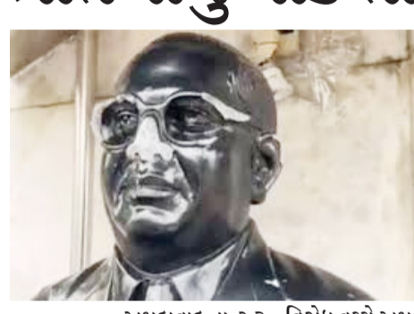
અમદાવાદ તા.૨૩ : કેન્દ્રીય ગૃહમંત્રી દ્વારા

સં સ દ મ ડ ડો . બા બા સ ા હે બ આં બે ડ કર ને લ ઈ ને આ પ વા મં અ વે લ ા નિ વે દ ન ને લઈ ને ચાલતા