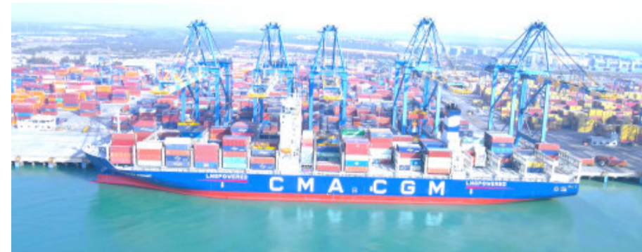
(LNG) સંચાલિત જહાજ તેના ઉત્સર્જનને નોંધપાત્ર રીતે ઘટાડવાની ક્ષમતાને કારણે શિપિંગ ઉદ્યોગમાં પસંદગીના ઈંધણ તરીકે સ્થાન મેળવી રહ્યું છે. તે પરંપરાગત દરિયાઈ ઈંધણની તુલનામાં પર્યાવરણને સુસંગત વિકલ્પ છે. ભારતની સૌથી મોટી પોર્ટ અને લોજિસ્ટિક્સ કંપની અદાણી પોર્ટ્સ અને સ્પેશિયલ ઈકોનોમિક ઝોન લિમિટેડના (APSEZ) ફ્લેગશિપ મુંદ્રા પોર્ટ અગાઉ સૌથી મોટા કન્ટેનર જહાજ MSC Anna લાંગરીને એક રેકોર્ડ બનાવ્યો હતો. MSC Anna ૨૬ મેના રોજ મુંદ્રા પોર્ટ ખાતે ડોક કરવામાં આવ્યું હતું. ભારતના સૌથી વ્યસ્ત રેફ્લેક્સ લાંગરવામાં આવેલું સૌથી બંદરોમાંનું એક મુંદ્રા ખાતે APL મોટું જહાજ હતું.

મુંદ્રા, તા. ૨૦ ઉપર જ બર્થ કરવામાં આવ્યું હતું તે ઉત્તમ શિપિંગ અને લોજિસ્ટિક્સ સોલ્યુશન્સ સર્વિસ આપવા અદાણી પોર્ટની પ્રતિબદ્ધતા જ નહીં, પરંતુ વધુ કાર્યક્ષમતા અને વિશ્વસનીયતા સાથે ગ્રાહકોને સેવા આપવાની દક્ષતાપણ દર્શાવે છે. સૌ પ્રથમ LNG-સંચાલિત જહાજ MV CMA CGM ફોર્ટ ડાયમન્ટની મુંદ્રા પોર્ટ ઉપરની યાત્રાને પોર્ટ ગર્વથી ઉષ્માભરે આવકારી હતી. મુંદ્રા પોર્ટ ખાતે ૨૧ મીટર ઉંડાઈ સુધીની કેપેસિટીના જહાજ સહજતાથી લંગારી શકે છે. દર અઠવાડિયે મેઈનલાઈનર જહાજોની આવાગમન સાથે વૈશ્વિક કનેક્ટિવિટી અને કન્ટેનર ટ્રાન્કિનેહેન્ડલ કરવા માટે જરૂરી આધુનિક ઈન્ફ્રાસ્ટ્રક્ચરને કારણે કન્ટેનર હબ બનવા પામ્યું છે. આ પોર્ટ રેલ અને રોડ દ્વારા રાજ્યના ધોરીમાર્ગો અને રેલ કોરિડોર દ્વારા તેના અંતરિયાળ વિસ્તારોમાં સારી રીતે જોડાયેલું છે. ઉપરાંત સુવર્ણ ચતુર્ભુજની DFC રેખાઓ સાથે સીધું જોડાયેલું છે. લિક્વિફાઈડ નેચરલ ગેસ