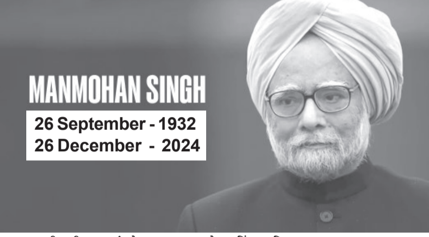
MANMOHAN SINGH 26 September - 1932 26 December - 2024

નવી દિલ્હી, તા. ૨૭ : ભૂતપૂર્વ વડા પ્રધાન અને ભારતના આર્થિક સુધારાના ઘડવૈયા ડો. મનમોહન સિંહનું ગત રાત્રે દિલ્હી એમ્સમાં તેમનું નિધન થયું હતું. તેમના નિધન પર કેન્દ્ર સરકારે ૭ દિવસનો રાષ્ટ્રીય શોક જાહેર કર્યો છે. ડો. મનમોહન સિંહના અંતિમ સંસ્કાર શનિવારે સંપૂર્ણ રાજ્ય સન્માન સાથે કરવામાં આવશે. સૂત્રોએ જણાવ્યું હતું કે શુક્રવારે પૂર્વ નિર્ધારિત તમામ સરકારી કાર્યક્રમો રદ કરવામાં આવ્યા છે. શુક્રવારે કેન્દ્રીય કેબિનેટની બેઠક થશે, જેમાં ભૂતપૂર્વ વડા પ્રધાનને શ્રદ્ધાંજલિ આપવામાં આવશે. ભારતના આર્થિક સુધારાના પિતા મનમોહન સિંહનું ગુરુવારે રાત્રે ૮૨ વર્ષની વયે અવસાન થયું. તેઓ ૨૦૦૪-૧૪ દરમિયાન ભારતના વડા પ્રધાન હતા. મનમોહન સિંહ ના નિધન બાદલ સમગ્ર દેશ શોકમાં ડૂબ્યો છે કાલે સવારે ૮ થી ૧૦ તેમનો મૃતદેહ કોંગ્રેસ કાર્યાલય ખાતે લઈ જાવશે અને પછી અંતિમ યાત્રા શરુ થશે .દરમિયાન આજે પીમ મોદી અને ગૃહ મંત્રી અમિત શાહએ સદગત ને શ્રદ્ધાંજલિ આપવામાં આવી હતી. ડો.મનમોહન સિંહ પૂર્વ વડા પ્રધાન રહી ચૂક્યા છે. તેથી, તેમના અંતિમ સંસ્કાર સંપૂર્ણ રાજ્ય સન્માન સાથે કરવામાં આવશે. સૂત્રોનું કહેવું છે કે મનમોહન સિંહના અંતિમ સંસ્કાર શનિવારે એટલે કે ૨૮ ડિસેમ્બરે કરવામાં આવશે. કેન્દ્ર સરકારે ભૂતપૂર્વ વડા પ્રધાન ડો. મનમોહન સિંહના નિધન પર સાત દિવસનો રાજ્ય શોક જાહેર કર્યો છે. આનો અર્થ એ છે કે ૨૮ ડિસેમ્બરથી ૧ જાન્યુઆરી સુધી રાજ્યમાં શોક રહેશે. કોંગ્રેસે પૂર્વ વડા પ્રધાન મનમોહન સિંહના સન્માનમાં સાત દિવસ માટે તેના તમામ સત્તાવાર કાર્યક્રમો પછા રદ કર્યાં છે.