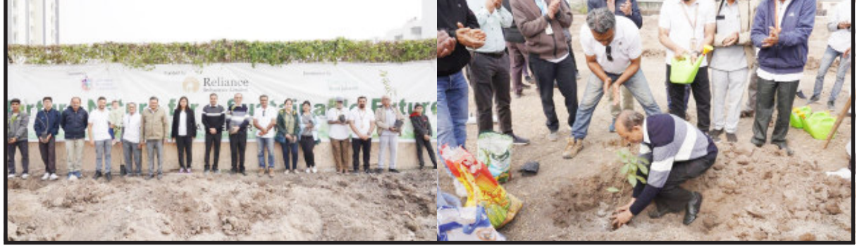
જામનગર મહાનગરપાલિકાના ગાર્ડન રીઝર્વ પ્લોટ - સોનલનગરમાં ૧૫૦૦૦ વૃક્ષોની હરિયાળી લહેરાશે : હાર્ટફૂલનેસ સંસ્થા દ્વારા વૃક્ષોના ઉછેર-સંભાળની જવાબદારી સ્વીકારી