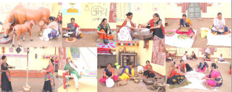
ઉમિયાધામ સિદ્ધસર શ્રી ૧૧ શતાબ્દી મહોત્સવ સિદ્ધસરના પાંચ દિવસીય મહોત્સવમાં વિવિધ ૧૦ જેટલા સંમેલન ઉપરાંત યજ્ઞશાળા, ક્લિલ નિર્દેશન ડોમ, આનંદ મેળો, કૃષિ મેળોની સાથે સાથે પાટીદાર ગ્રામીણ સંસ્કૃતિનું લાઈવ પ્રદર્શનએ ભારે આકર્ષણ જણાવ્યું છે. પાટીદાર સંસ્કૃતિ પ્રદર્શન જોવા પણ ભાવિકો ઉમટી રહ્યા છે. ખોબા જેવા સિદ્ધસર ખાતે ખેતરોમાં ૧૬ ચો.કી.મી. વિસ્તાર આશરે ૬૫૦ વિદ્યામાં યોજાયેલ શ્રી ૧૧ શતાબ્દી મહોત્સવમાં પાટીદારોના જીવન કથન દર્શાવતું પ્રદર્શન લાઈવ પાટીદાર ગ્રામીણ સંસ્કૃતિ મહોત્સવના મુલાકાતીઓમાં ઉત્સાહભરે નિહાળી રહ્યા છે. જેમાં ૫૫ બહેનોની ટીમ દ્વારા ચુલા ઉપર રસોઈ, વલોણા ઉપર છાશ બનાવતી પાટીદાર મહિલા, ચોપટ રમતા બહેનો, અનાજ દળવાનો ઘંટુડો, ઘોડીયામાં બાળકને સુવાડવતી મહિલા, ગાય દોહતી મહિલાઓ, પટારા ઉપર ડામચીઓ, કાંધી ઉપર પિતળના વાસણો, ઢાળીયા (ખાટલા) ઉપર બેસેલા પાટીદાર વૃધ્ધ સહિતનું લાઈવ નિદર્શન થઈ રહ્યું છે. અદર બે કલાકે મહિલાઓની શીફટ લાઈવ પ્રદર્શનમાં જોવા મળે છે. ઉપરાંત પાટીદાર સંસ્કૃતિ દર્શનમાં ખેતીના સાધનો, ખેત ઓજારો, ઠીંચણીયા, વલોણું, બળદ ગાડું, રૂ પીંજવાની તાગડી, પટારો સહિતની અનેક વસ્તુઓ પ્રદર્શનમાં મુકવામાં આવી છે.