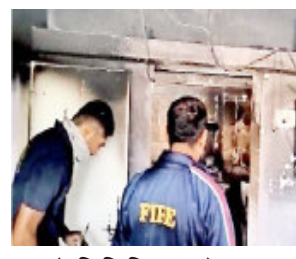
જૂનાગઢ તા.૨૮ જૂનાગઢ શહેરની આશિયાના સોસાયટીના એક