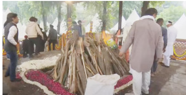
નવી દિલ્હી, તા. ૨૮ દેશના પૂર્વ વડાપ્રધાન તથા ભારતીય આર્થિક ઉદારીકરણનાં સુધારા-શિલ્પી

ડો. મનમોહનસિંહના નિધન બાદ આજે સંપૂર્ણ રાજકીય સન્માન સાથે અંતિમ સંસ્કાર કરવામાં આવ્યા હતા. ડો. મનમોહનસિંહના પાર્થિવ શરીરને આજે સવારે કોંગ્રેસ વડામથકે અંતિમ દર્શનાર્થે રાખવામાં આવ્યું હતું અને ત્યાંથી અંતિમયાત્રા યોજાઈ હતી. કોંગ્રેસ પ્રમુખ ખડગે, રાહુલ ગાંધી, પ્રિયંકા ગાંધી વગેરેએ હુલહાર કરીને અંતિમ દર્શન કર્યા હતા. મોટી સંખ્યામાં કોંગ્રેસ સહીતનાં રાજકીય નેતાઓ, આગેવાનો, કાર્યકરો અંતિમ દર્શન કરવા માટે પહોંચ્યા હતા. નિગમ બોધઘાટ ખાતે અંતિમ સંસ્કાર વખતે ઉપસ્થિત નેતાઓ-કાર્યકરો સહીત લાખો દેશવાસીઓની આંખો ભીની થઈ હતી. ૨૧ તોપની સલામી સાથે સંપૂર્ણ રાજકીય સન્માન સાથે તેઓનાં અંતિમ સંસ્કાર કરાયા હતા. દેશમાં સાત દિવસનો શોક જાહેર કરવામાં આવ્યો હતો. પ્રખર અર્થશાસ્ત્રી એવા ડો. મનમોહનસિંહ રિઝર્વ બેંકનાં ગવર્નરથી માંડીને વડાપ્રધાન પદ સુધી રહી ચુક્યા હતા અને આર્થિક સુધારા સાથે ભારતીય