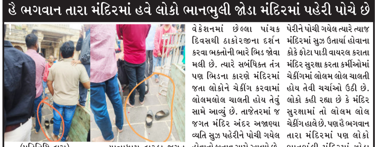
(પ્રતિનિધિ દ્વારા) યાત્રાધામ દારકા જગત દારકા તા.૩૦ મંદિરે હાલ નાતાલના મિની વેકેશનમાં છેલ્લા પાંચક દિવસથી ઠાકોરજના દર્શન કરવા ભક્તોની ભારે ભિડ જોવા મળી છે. ત્યારે સંબંધિત તંત્ર પણ ભિડના કારણે મંદિરમાં જતા લોકોને ચેકીંગ કરવામાં જતા લોકોને ચેકીંગ કરવામાં લોલમલોલ ચાલતી હોય તેવું સામે આવ્યું છે. તાજેતરમાં જ જગત મંદિર અંદર અજાણ્યા વ્યતિ સુઝ પહેરીને પોચી ગયેલ હોવાનો બનાવ સામે આવ્યો છે. જે વ્યતિ જગત મંદિર અંદર સુઝ પેરીને પોચી ગયેલ ત્યારે ત્યાજ મંદિરમાં સુઝ ઉતાર્યા હોવાના કોડે ફોટા પાડી વાયરલ કરાતા મંદિર સુરક્ષા કરતા કર્મીઓમાં ચેકીંગમાં લોલમ લોલ ચાલતી હોય તેવી ચર્ચાઓ ઉઠી છે. લોકો કહી રહ્યા છે કે મંદિર સુરક્ષામાં તો લોલમ લોલ ચેકીંગ હાલ છે. પણ હે ભગવાન તારા મંદિરમાં પણ લોકો ભાનભુલી મંદિરમાં જોડા પહેરી પહોંચ્યા છે.