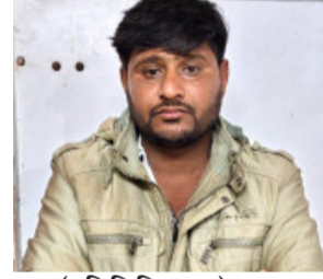
(પ્રતિનિધિ દ્વારા) જામ ખંભાળિયા તા.૪