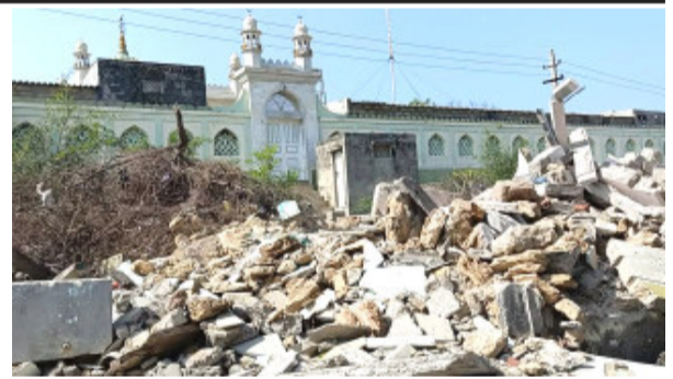
પર દબાણ દૂર કરવાની કાર્યવાહી મોડે સુધી ચાલી હતી. હાલમાં યાત્રાધામ દ્વારકા

(પ્રતિનિધિ દ્વારા) જામ ખંભાળિયા, તા. ૪ હાલ બેટ દ્વારકાનું વિકાસ ચાલુ હોવાથી સરકારી જમીન પચાવી લેનારો પાસેથી જમીન મુક્ત કરવાની તંત્ર દ્વારા કડક કામગીરી કરવામાં આવી રહી છે. જેમાં ગઈકાલે શુક્રવારે ઓખા નગરપાલીકા, ઓખા પોલિસ તેમજ દ્વારકા પ્રાંત અધિકારી સહિતના અધિકારીઓ ઘટના સ્થળે પહોંચી ગયા હતા. બેટ દ્વારકાના સુદર્શન સેતુ નજીક ૮૦ મીટર જેટલી દીવાલ ધરાશાઈ કરવામાં આવી છે. જ્યારે દરિયા કિનારે હાજી કિરમાણી દરગાહ પાસે ૨૦૦ ફૂટનું બાંધકામ તોડવામાં આવ્યું હોવાનું જાણવા મળ્યું છે. આમ ઓખા નગરપાલીકા દ્વારા બેટ દ્વારકામાં અનધિકૃત દબાણો દૂર કરવા આ કામગીરી હાથ ધરવામાં આવી રહી છે. જેમાં પ્રસિદ્ધ યાત્રાધામ બેટ દ્વારકામાં સરકારી જમીન