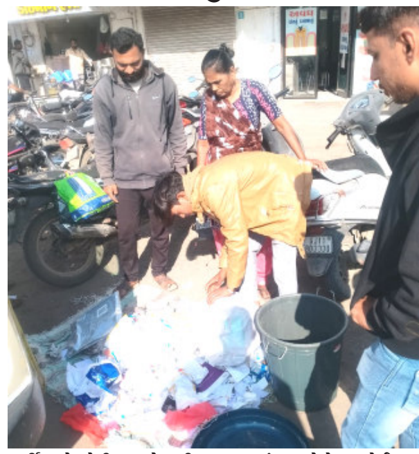
સર્વિસ કે મેડીકલ સેવાકીય એકમો માંથી ઉત્પન્ન થતો બાયોમેડીકલ વેસ્ટને યોગ્ય રીતે નિકાલ કરવાનો રહેશે તેમજ પ્રતિબંધીત પ્લાસ્ટીકનો ઉપયોગ, સંગ્રહ કે વેચાણ કરવા નહિ અન્યથા ગુના મુજબ દંડ વસુલ કરવામાં આવશે.

જૂનાગઢ, તા.૯ 'કિરણ ઈમેજીંગ સેન્ટર'માં ડૉ.ઓમ પ્રકાશ યબક માન.કમિશનરશ્રી મહાનગર પાલિકા, જૂનાગઢના માર્ગદર્શન અને ડી.જે.જાડેજા નાયબ કમિશનર અને કલ્પેશ ટોલીયા આસી.કમિશનર ટેકસ અને સેનીટેશન સુપ્રી.ની સુચના મુજબ શહેરને સ્વચ્છ રાખવા અને સુકા ભીના કચરાને અને કચરાના પ્રકાર મુજબ સંગ્રહ અને નિકાલ થાય તે અંગેના ચેકીંગ માટે ખાસ સ્કવોડની રચના કરવામાં આવેલ છે. આ સ્કવોડ દ્વારા કચરાને અલગ અલગ સંગ્રહ ન કરવા અને નિકાલ કરતા તથા જાહેર માં ગંદકી અને પ્રતિબંધીત પ્લાસ્ટીકના ઉપયોગ, વેચાણ અને સંગ્રહ કરતા શહેરીજનો સામે નીચમીત ચેકીંગ હાથ ધરવામાં આવે છે. આજ રોજ ચેકીંગ દરમ્યાન સરદારબાગ રોડ દવારકાધીસ માર્કેટની બાજુમાં ડૉ.મગનભાઈ ભાંખર