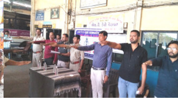
વેરાવળ, તા.૯ વેરાવળ એસ.ટી. ડેપો ખાતે નેશનલ રોડ સેફ્ટી મન્થ-૨૦૨૫ની ઉજવણી કરવામાં આવી હતી. જે અંતર્ગત ગીર સોમનાથ સહાયક વાહન વ્યવહાર પ્રાદેશિક કચેરીના અધિકારીશ્રીઓ દ્વારા વેરાવળ એસ.ટી. ડેપો ખાતે એક સેમિનાર યોજાયું હતો. જેમાં આર.ટી.ઓના અધિકારીશ્રીઓ સહિત તજજ્ઞોએ એસ.ટી.ના ડ્રાઈવર કર્મચારીઓને ડ્રાઈવિંગ કરતી વખતે રાખવાની થતી કાળજી તેમજ ટ્રાફિક સિગ્નલ