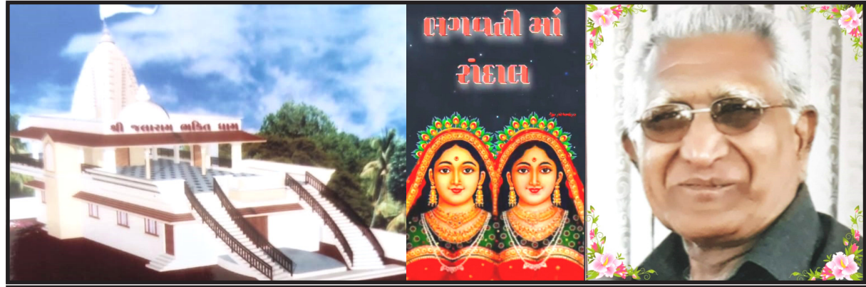
એકસાથે ૭૦ દંપતિઓ પૂજનવિધિમાં બેસી ૧૫૨૬ ગોઈણીઓના પગ ધોઈ પૂજા કરશે