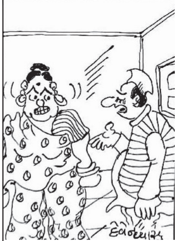
પક્ષમાં મોવડીઓ શિસ્તનું પાલન કરાવે અને ઘરમાં તું! આમાં મારે જાવું ક્યાં?

લોકોની આસ્થા સમા અને ભારતની રાષ્ટ્રીય અસ્મિતા સમા આ મંદિર રાષ્ટ્રભાવના સહભાગી બને છે. ૧૩ નવેમ્બર ૧૯૪૭ના રોજ તત્કાલીન ભારતના નાયબ વડાપ્રધાન વલ્લભભાઈ પટેલે જીર્ણ સોમનાથ પ્રાચીન મંદિરની મુલાકાત લીધી હતી ત્યારે તે જમાનામાં કુલના બુકેથી જાન્યુઆરીએ સંધ્યાને સોમનાથ કાર્યક્રમ હોય છે પરંતુ કરોડો લોકોની આસ્થા સમા અને ભારતની રાષ્ટ્રીય અસ્મિતા સમા આ મંદિર રાષ્ટ્રભાવના સહભાગી બને છે. ૧૩ નવેમ્બર ૧૯૪૭ના રોજ તત્કાલીન ભારતના નાયબ વડાપ્રધાન વલ્લભભાઈ પટેલે જીર્ણ સોમનાથ પ્રાચીન મંદિરની મુલાકાત લીધી હતી ત્યારે તે જમાનામાં કુલના બુકેથી જાન્યુઆરીએ સંધ્યાને સોમનાથ કાર્યક્રમ હોય છે પરંતુ કરોડો