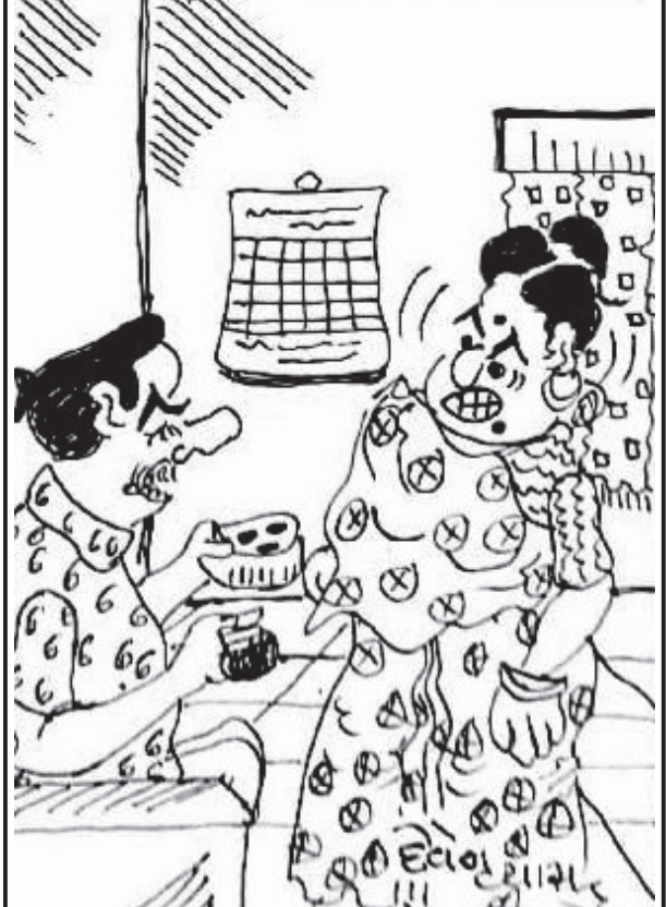
તારા બનાવેલા આ સુગર ફ્રી અડદીયા ખાવા જતાં મારાદાં તો નહિ પડી જાય ને?