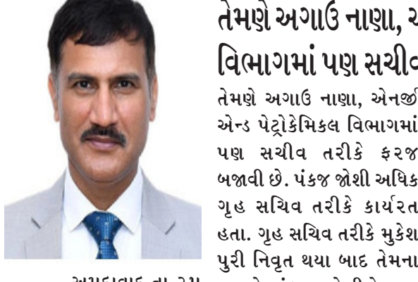
અમદાવાદ,તા.૨૫ ગુજરાતને નવા મુખ્ય સચિવ મળ્યા છે. ગુજરાતના નવા મુખ્ય સચિવ તરીકે પંકજ જોશી નીમવામાં આવનારા હોવાનું સૂત્રો દ્વારા જાણવા મળ્યું છે. રાજ્યના વર્તમાન સચિવ સીએસ રાજકુમાર ૩૧મી જાન્યુઆરીએ નિવૃત્ત થાય છે. આમ તેઓ ૩૧મી જાન્યુઆરીએ વિધિવત વિદાય લેશે. તેઓ વર્ષ ૧૯૮૯ બેચના આઈએએસ અધિકારી છે.

રાજકુમાર એ પ્રિલ ૨૦૧૫થી કેન્દ્રમાં હતા અને નાણા, શ્રમ-રોજગાર, સંરક્ષણ વિભાગમાં કામ કર્યું હતું. તેના પછી તેમને ગુજરાત પરત લાવવામાં આવ્યા હતા. તેઓ રાજ્યમાં તેમના કાર્યકાળ દરમિયાન ગુજરાત સરકારની મહત્વની કામગીરીનો આધારસ્તંભ રહ્યા હતા. આમ ગુજરાત સરકારના મહત્વના નિર્ણયોમાં તેમનું અનેરું પ્રદાન હતું.