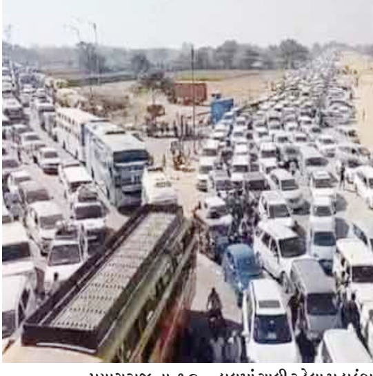
પ્રયાગરાજ, તા. ૧૦ દુનિયાના સૌથી મોટા ધાર્મિક મેળાવાડા એવા પ્રયાગરાજમાં

સ્થિતિ બેકાબુ : વિશ્વના સૌથી મોટા ટ્રાફિક જામથી કરોડો શ્રદ્ધાળુઓને ભારે મુશ્કેલી : ૧૪ ફેબ્રુઆરી સુધી સંગમ સ્ટેશન બંધ કરાયું : મધ્યપ્રદેશમાં ૪ વાહનો અટકાવી દેવાયા