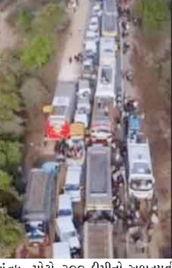
મોટો ૩૦૦ કીમીનો અભૂતપૂર્વ ટ્રાફિક જામ સર્જાયો છે. વાહનોને અધવચ્ચે જ રોકી દેવામાં આવતા

કલાકો સુધી ફસાયેલા શ્રદ્ધાળુઓને ખાવા પીવાના સાંસા પડયા છે અને ૨૦-૨૫ કીમી પગપાળા જવાની નોબત આવી છે. અભૂતપૂર્વ ભીડને કારણે સંગમ સ્ટેશન ૧૪ ફેબ્રુઆરી સુધી બંધ કરી દેવાની જાહેરાત કરવામાં આવી છે.