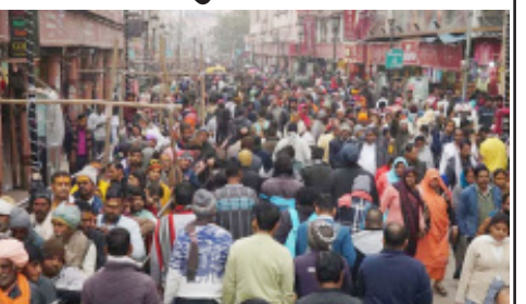
ભીડના કારણે રવિવારે હાઈવે અને તેની સાથે જોડાયેલ શહેરના બધા રસ્તા ચોક થઈ ગયા છે. કાશી વિશ્વનાથ મંદિરવાળા રસ્તા પર તો પગ રાખવાની જગ્યા પણ નહોતી રાની તળાવથી મોહનસરાય સુધી લગભગ અડી કલાકનું અંતર કાપવામાં બાઈક સવારોને દોઢ કલાક લાગ્યો હતો.

અયોધ્યા તા. ૧૦ રામનગરીમાં અયોધ્યામાં પણ લગભગ ૧૦ લાખ શ્રદ્ધાળુઓની ભીડ પહોંચી હતી, ભીડને નિયંત્રીત કરવા માટે ૧૭ જગ્યાઓ પર લાગેલા બેરિયર બંધ કરવા પડયા હતા. રામમંદિર અને હનુમાનગઢીથી બે કિલોમીટરથી જ રૂટ ડાયવર્ઝન અને કાઉન્ટ હોલ્ડીંગ કરવામાં આવ્યું હતું. દર્શનનો સમય વધાર્યા પછી પણ લોકોને બાલકરામનાં દર્શન માટે બેથી ત્રણ કલાક લાઈનમાં ઉભા રહેવું પડે છે. અયોધ્યાનાં ધારાસભ્ય વેદપ્રકાશ ગુમાના જણાવ્યા અનુસાર માધ પૂર્ણિમા સુધીમાં ૨૦ લાખથી વધુ લોકો પહોંચવાનું અનુમાન છે.