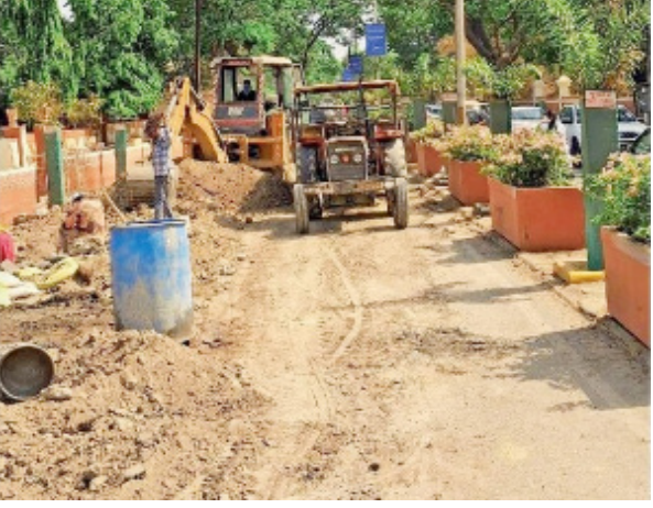
જૂનાગઢ તા. ૧૬ તોડફોડના કામો થઈ રહ્યા છે. જૂનાગઢ શહેરમાં અનેક વિસ્તારોમાં છેલ્લા ઘણાં સમયથી

શહેરમાં ભુગર્ભ ગટરની લાઈન તો ક્યારેક પાણીનીલાઈન, ગેસની લાઈન તેમજ અન્ય કંપનીઓનાં કામો અંતર્ગત રસ્તાની તોડફોડ સતત ચાલુ જ રહે છે : પ્રજાના બુરા હાલ