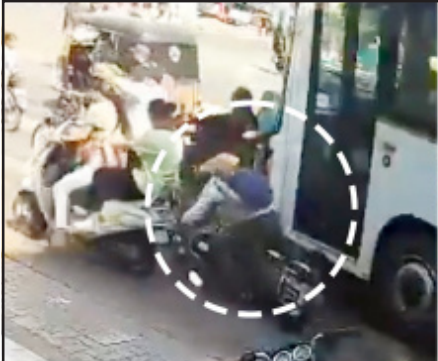
રાજકોટ તા. ૧૬ : આજે સવારે રાજકોટમાં ઈન્દિરા સર્કલ પાસે એક બેફામ સિટી બસવાલકે વાહનોને અડફેટે લેતાં અફરાતફરીનો માહોલ સર્જાયો હતો. ગોઝારા અકસ્માતમાં ૪