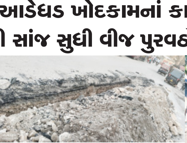
યોગ્ય સુપરવીઝન વીના થયેલ ખોદકામને કારણે કોમર્શીયલ જનતા ચોકમાં વીજ પુરવઠો આશરે ૩ વાગ્યાથી બંધ થયેલ છે અને કોઈ જવાબદાર લોકોએ જવાબદારી ન લેતા પી. જી. વી. સી. એ. લ. ને અવારનવાર જાણ કર્યા પછી પી. જી. વી. સી. એ. લ. ની ટીમ આવી હતી. વધુમાં બેંકો, કોમર્શીયલ દુકાનો, એ.ટી.એમ. વિગેરે જે પી. જી. વી. સી. એ. લ. ના વીજ કનેક્શન આધારીત હોય છે અને આ બધા વ્યવહારો ખોરવાઈ જતા આજુ-બાજુના કોમર્શીયલ વિસ્તારોના તથા ગ્રાહકોને ખુબ જ તકલીફ ભોગવવાનો વારો આવ્યો છે. તે સંજોગોમાં આ જે બનાવ બનેલ છે તે માટે જવાબદાર વ્યક્તિઓ સામે પગલા લેવા અને ભવિષ્યમાં આવા બનાવો ન બને તે માટે કોન્ટ્રાક્ટર, અધીકારી તથા

સુપરવાઈઝરોની જવાબદારી નક્કી કરવા અને આ બાબતે યોગ્ય કરવા માંગણી કરાઈ છે.