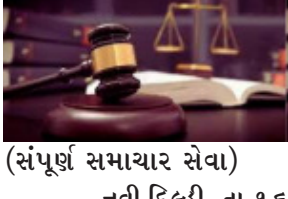
(સંપૂર્ણ સમાચાર સેવા) નવી દિલ્હી, તા. ૧૬ લો કમિશનની ભલામણ મુજબ ભારતમાં દર ૧૦ લાખની વસતીએ ૫૦ જજ હોવા જોઈએ. જ્યારે ૨૦૨૫ની સ્થિતિ સંદર્ભે ૨૫ થયેલા રિપોર્ટ મુજબ, ભારતમાં દર ૧૦ લાખની

સમગ્ર દેશમાં ડિસ્ટ્રિક્ટ કોર્ટમાં જજ દીઠ ૨,૨૦૦ કેસનું ભારણ છે, અલ્ટ્રાબાદ અને મધ્યપ્રદેશ હાઈકોર્ટમાં જજ દીઠ ૧૫,૦૦૦ કેસ છે. વસતીએ માત્ર ૧૫ જજ છે. ભારતના વિવિધ રાજ્યોમાં ન્યાયપાલિકાની સ્થિતિ અંગે ઈન્ડિયા જસ્ટિસ રિપોર્ટ મંગળવારે પ્રસિદ્ધ થયો છે. આ રિપોર્ટ મુજબ, દેશનદી વિવિધ હાઈકોર્ટમાં મંજૂર માળખાની સરખાણીએ જજની ૩૩ ટકા જગ્યા ખાલી છે. અમેરિકામાં જાન્યુઆરી ૨૦૨૪ની સ્થિતિએ ૧૦ લાખની વસતીએ ૧૫૦ જજ છે અને યુરોપમાં ૨૦૨૨ની સ્થિતિએ ૧૦ લાખની વસતી સામે ૨૫૦ જજ છે. દેશભરમાં ૧.૪ અબજ વસતીની સામે જજની સંખ્યા ૨૧,૨૮૫ છે. આમ, દર ૧૦ લાખની વસતીમાં માત્ર ૧૫ જજ છે. ૧૯૮૦ના વર્ષમાં લો કમિશને કરેલી ભલામણ મુજબ, દર ૧૦