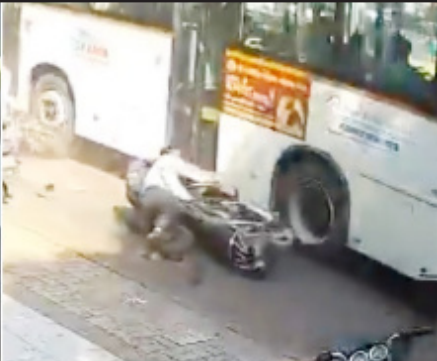
વાહનોના ઘટનાસ્થળે જ મોત નીપજ્યાં હતાં, જ્યારે ૨ લોકો ગંભીર રીતે ઈજાગ્રસ્ત થતાં તેમને તાત્કાલિક સિવિલ હોસ્પિટલ સારવાર માટે ખસેડાયા હતા. અકસ્માત બાદ લોકોનું ટોળું