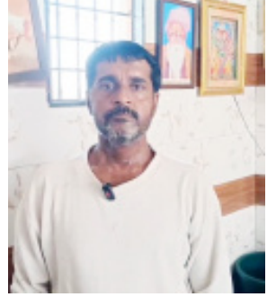
પોતાના પાન કાર્ડની ગુપ્તતા ખુબ સાવચેતી પૂર્વક જાળવવી જોઈએ તે પણ જરૂરી છે.

ઈબરડો છે કે કોઈ મોટું છતરપિંડી કોભાંડ છે તે અંગે અનેક પ્રશ્નો ઉભા થયા છે. આ સમગ્ર બાબતે અમારા પ્રતિનિધિએ આવકવેરા વિભાગના નિષ્ણાંત અધિકારી સાથે વાતચીત કરી તો એમણે બિનસત્તાવાર નિવેદન આપતા કહ્યું કે આ યુવકના પાન કાર્ડ અને અન્ય દસ્તાવેજોનો ઉપયોગ કરીને તેના નામે કોઈએ નાણાકીય વ્યવહારો કર્યા હોઈ શકે છે અને આ રીતે તેની સાથે ફોડ થયું હોઈ શકે છે. અત્રે ઉલ્લેખનીય છે કે આ ઘટના ઉપરથી એક મહત્વની વાત સમજવા જેવી છે કે નાગરિકોએ પોતાના પાન કાર્ડની ગુપ્તતા જાળવવી જોઈએ. પાન કાર્ડ નંબર કોઈ કૌભાંડીના હાથે ચડી જાય તો તમારી જાણ બહાર મોટા આર્થિક વ્યવહાર થઈ શકે છે અને અંતે ભોગવવાનો વારો આવે છે. આ ઘટના ઉપરથી નાગરિકોએ