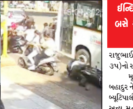
ઘટનાસ્થળે એકઠું થઈ ગયું હતું અને બસમાં તોડફોડ કરીને ભારે ઢોબાળો મચાવ્યો હતો. લોકોના રોષથી વણસેલી સ્થિતિ કાબૂમાં લેવા પોલીસે ઠાકીયાજી કરવો પડ્યો હતો. અકસ્માતમાં બસ-ડ્રાઇવર

ઈન્દિરા સર્કલ ટ્રાફિક સિગ્નલ ખાતે માતેલા સાંઠની જેમ ઘસી આવેલી સીટી બસે સાત-આઠ વાહનોને હડફેટે લીધા : રોષે ભરાયેલા લોકોએ સીટી બસમાં તોડફોડ કરી : ડ્રાઇવરને માર માર્યો : પોલીસનો લાડીચાઈ