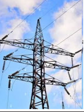
જૂનાગઢ તા. ૧૬ જૂનાગઢ શહેરનાં હાઈવોલ્ટેજનાં વિસ્તાર એવા માંગનાથ રોડ અને પંચહાટડી ચોકમાં વારંવાર વીજ ધાંધિયા સર્જવાનાં કારણે વેપારીઓ અને જનતા પરેશાન છે. અવારનવાર આ બાબતે રજૂઆત કરવામાં આવે છે પરંતુ કોઈ સરખો જવાબ દેવામાં આવતો નથી અને

છાશવારે વીજ ધાંધિયા સર્જાયા રાખે છે. જૂનાગઢ શહેરમાં જ્યાં વિવિધ બજારો આવેલી છે તેવા માંગનાથ રોડ અને પંચહાટડી ચોક એટલે કે જૂનાગઢ શહેર તેમજ આસપાસનાં વિસ્તારોનું મુખ્ય હટાણાનું મથક ગણાય છે. અહીં ચમ્પલથી માંડીને કરીયાણું, વસ્ત્રો તેમજ જુદી જુદી ચીજવસ્તુઓની શોપ આવેલી છે. સવારથી લઈ સાંજ સુધી ગ્રાહકો દ્વારા ચીજવસ્તુઓની ખરીદી થતી હોય છે અને સતત ધમધમતો આ વિસ્તાર છે. હાલ ઉનાળાના દિવસો ચાલી રહ્યા છે ત્યારે બાપોરનાં સમયે આકાશમાંથી અગન વર્ષા થતી હોય તેવો માહોલ રહેલો છે ત્યારે ગરમીની સામે રાહત મેળવવા