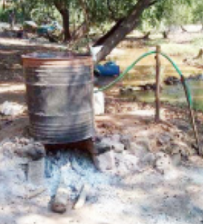
જૂનાગઢ તા. ૧૬ જૂનાગઢ રેન્જનાં પોલીસ માહનિરીક્ષક નિલેશ ઝાંઝડીયા તેમજ ઈન્ચાર્જ પોલીસ અધિક્ષક ભગીરથસિંહ જાડેજાની સૂચના અને માર્ગદર્શન હેઠળ જૂનાગઢનાં નાયબ પોલીસ અધિક્ષક હિતેશ ધાધલીયાનાં નેતૃત્વમાં અહે ડીવીઝન પોલીસ સ્ટેશનનાં પીઆઈ અર. કે. પરમાર તેમજ વિવિધ પોલીસ સ્ટાફ અને એલસીબી, એસઓજ તેમજ સી ડીવીઝન, ભવનાથ પોલીસ સહિતની અલગ અલગ ૧૦ જેટલી ટીમો

બનાવી જૂનાગઢનાં પંચેશ્વર વિસ્તારનાં અલગ અલગ સ્થળો પર દેશી દારૂ અંગે દરોડો પાડતા દેશી દારૂસની ભઠ્ઠીને ઝડપી લેવામાં આવી હતી. દારૂ લીટર ૮૪૦, દારૂ બનાવવાનો આથી ૧૪૭૯૦ તેમજ દારૂ બનાવવાની ભઠ્ઠીનાં સાધનો મળી કુલ રૂ. ૫.૬૫૬૨૦નો મુદામાલ જપ્ત કરી ૧૬ કેસ નોંધવામાં આવેલ છે. દેશી દારૂની ભઠ્ઠીઓ ઉપર દરોડા પાડવાની આ કાર્યવાહીને કારણે દારૂનો ધંધો કરનારાઓમાં ફફડાટ ફેલાયો છે.